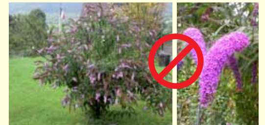
BUDDLÉJA, ARBRE À PAPILLONS