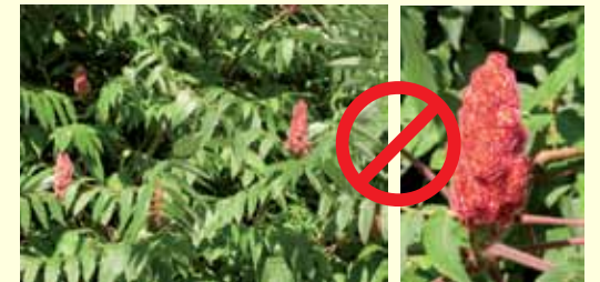
SUMAC OU VINAIGRIER