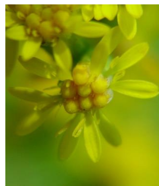
S. gigantea Fleurs ligulées plus longues que les tubulées