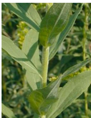
S. canadensis Tige verte, cotonneuse dans la partie supérieure