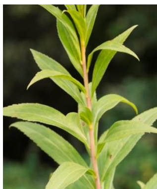
S. gigantea Tige glabre, rougeâtre dans la partie supérieure