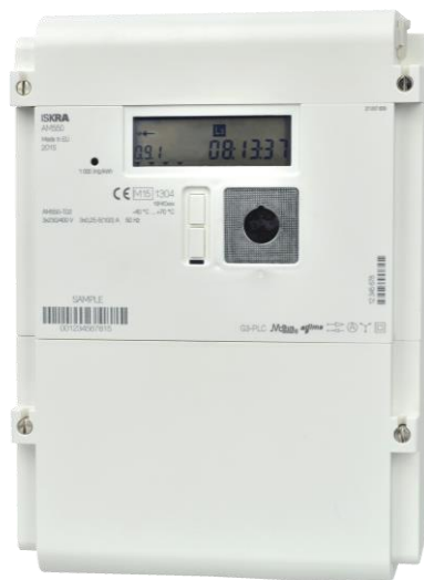
Figure 1 : Compteur Iskraemeco AM550

Il s'agit en l'occurrence du compteur de la marque " Iskraemeco ", de type AM550, fabriqué en Slovénie ( figure 1 ). Celui-ci répond aux exigences définies par la Confédération concernant les systèmes de mesures intelligents.